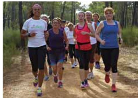
Joggingpass under Springtimes VårRusetvecka 2014.

Innan du startar lämnar du ditt tävlingsbidrag i brevlådan intill scenen. Prisutdelning sker från scenen, ca 20.30.